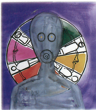
ILLUSTRASJONER: BJØRN CARLSEN