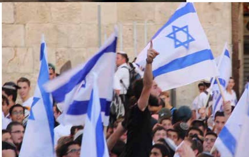
Land of Olives