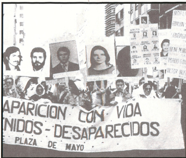
Santiago de Chile i mars 1991

Men bak statistikk og tall er det mennesker som gråter. Er det levende kvinner og menn som tortureres, som myrdes - som ligger der våken i sengen om natten og lytter etter skritt fra sine kjære som aldri kommer.