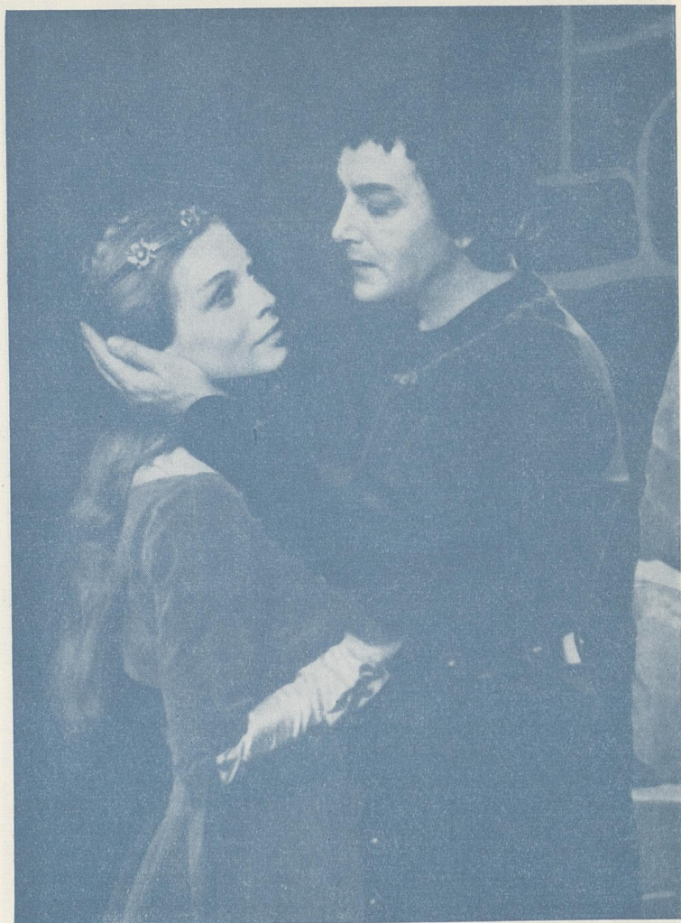
Rut Tellefsen som Kristin og Georg Løkkeberg som Erlend.