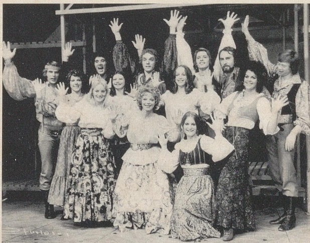
Veronesere og milanesere.