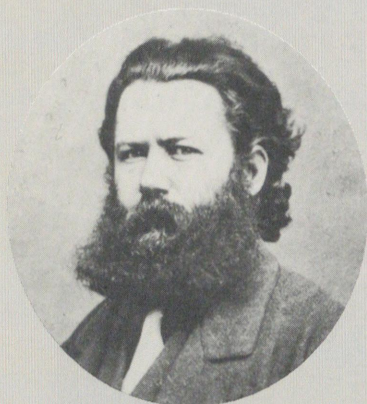
Henrik Ibsen i 1863/64. Han var 35 år gammel da han skreiv «Kongsemnerne».