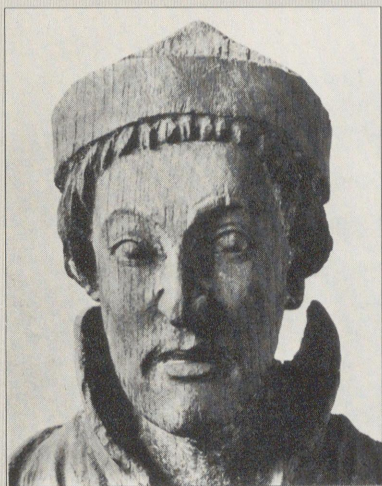
Denne bispeskulpturen i tre frå Haslum kyrkje i Bærum førestiller truleg baglarbispesen Nikolas Arnesson.