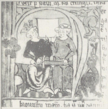
Initial frå Flateyjarbók, der Soga om Håkon Håkonsson tek til. Inne i initialen (ein h) visstnok bilete av ein konge som utnemner ein mann til hertug og gjev han sverd og stridsmerke (fane).

Da jula var gått, tok dei på ferd frå Hamar og fór dit som guten var, og førte han og mora bort med seg til Litle-Hamar, og veik så deretter til Østerdalen og etla seg derifra nord til Trondheimen.