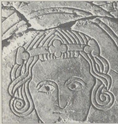
Steinplate som kan ha lege over grava til hertug Skule. Innrita mannsandlet med hertugkrone.