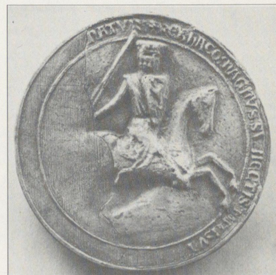
Håkon Håkonssons majestetsegl. Segl-stampen var utført av ein engelsk gullsmed og vart år 1236 send som gåve frå kong Henrik III av England til kong Håkon. Riksarkivet, Oslo.