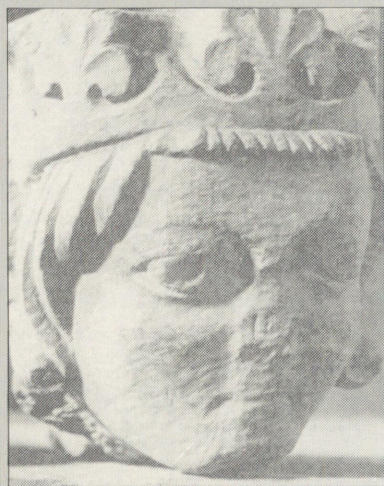
Steinhovud av barnekonge frå korgesimsen i Nidarosdomen, kan hende Håkon Håkonsson. 1200-åra.

På denne ferda sleit dei mykje vondt av styggever og frost og snø. Dei var stundom ute om nettene i skogar og audner. Ein kveld vart det så fælt ver at dei visste ikkje kvar dei fór. Da tok dei to som var dei beste skilauparane, til å fare føre med guten; den eine heitte Torstein Skeivla og den andre Skjervald Skrukka. Dei fekk to bønder som var kjende der, til å syne vegen. Dei fór så snøgt som dei kunne, men fann likevel ikkje fram til bygda.