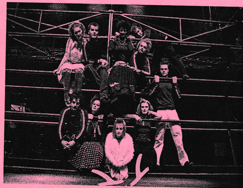
Program og forsidefoto: Nils S. Aasheim

4., 6., 7., 9., 10., OG 11. MAI 2005, SCENE 6.