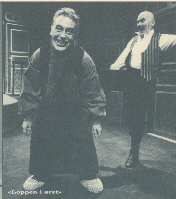
«Loppen i øret»