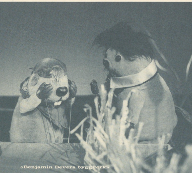
«Benjamin Bevers byggverk»