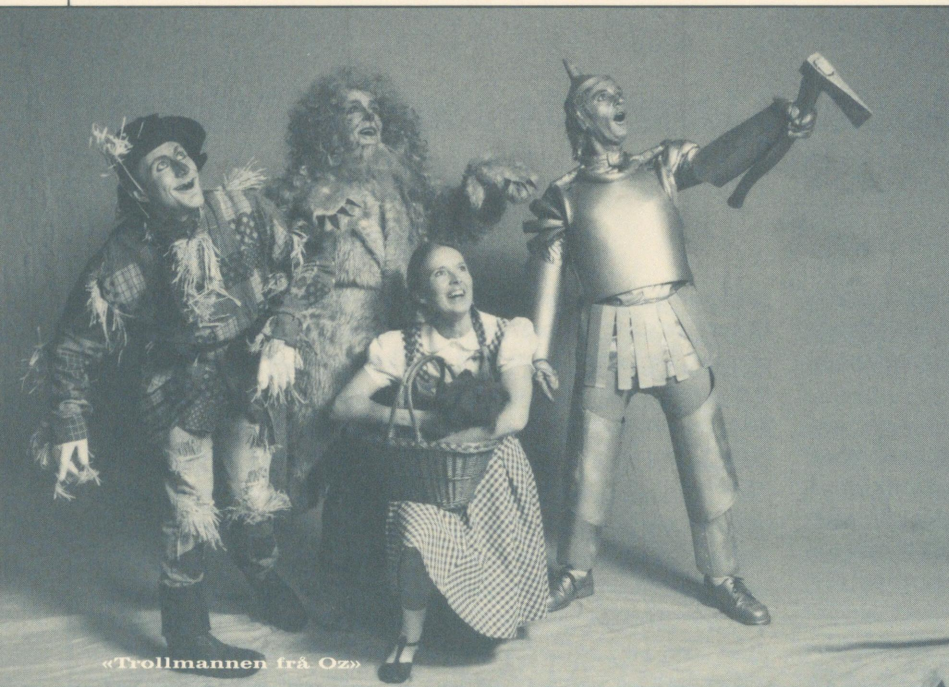
«Trollmannen frå Oz»