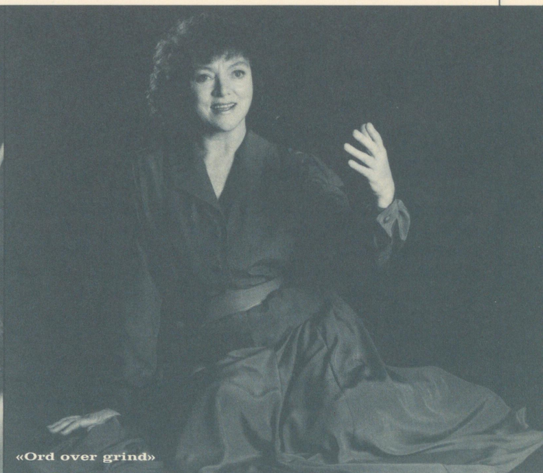
«Ord over grind»