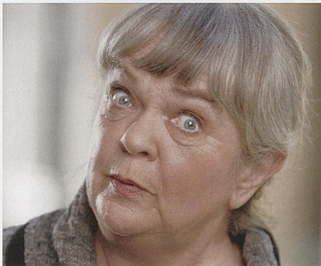
JACOBSEN, VÆRSÅGOD! Spilles t.o.m. 25. mai Samproduksjon, Centralteatret