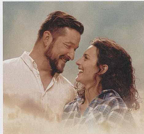
Musikalen SÅ SOM I HIMMELEN Norgespremiere 30. januar 2020 Hovedscenen