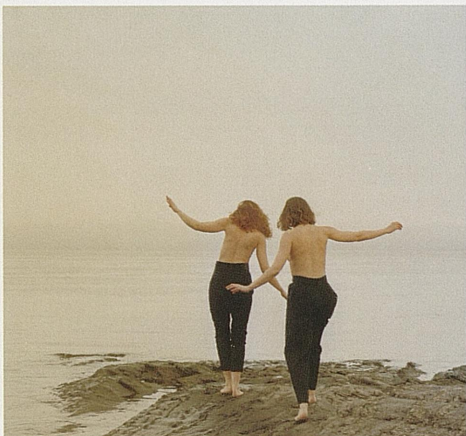
MIN BRILJANTE VENNINGNE Norgespremiere 5. september Hovedscenen