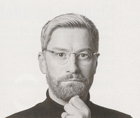
WHAT IS LOVE Urpremiere 11. september Samproduksjon, Centralteatret