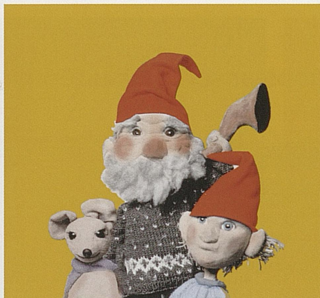
JUL MED PRØYSEN OG SNEKKER ANDERSEN Sesongpremiere 16. november Trikkestallen