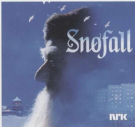
SNØFALL Sesongpremiere 14. november 2019 Hovedscenen