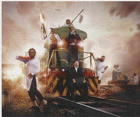
2010 - LOLLYWOOD. STATSTEATRET Spilles t.o.m. 27. april Samproduksjon, Centralteatret