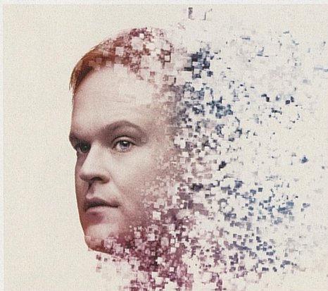
MARJORIE PRIME Norgespremiere 29. august Trikkestallen