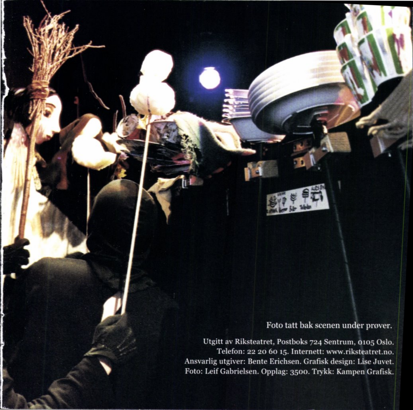
Foto tatt bak scenen under prøver.

Utgitt av Riksteatret, Postboks 724 Sentrum, 0105 Oslo.