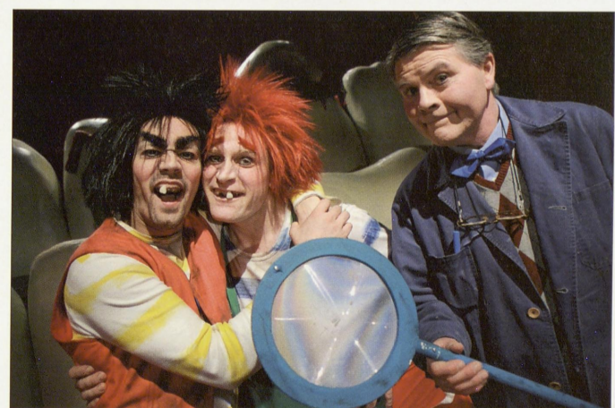
PROGRAM May Selmer / Geir Schønberg ANSVARLIG UTGIVER Otto Homlung

INSPISIENT Line Åmli SUFFLØR Ann Eli Aasgård REKVISITØR Turid Bjørnsen TEKNISK KOORDINATOR Trond Skaug MUSIKALSK RÅDGIVER Ivar Gafseth