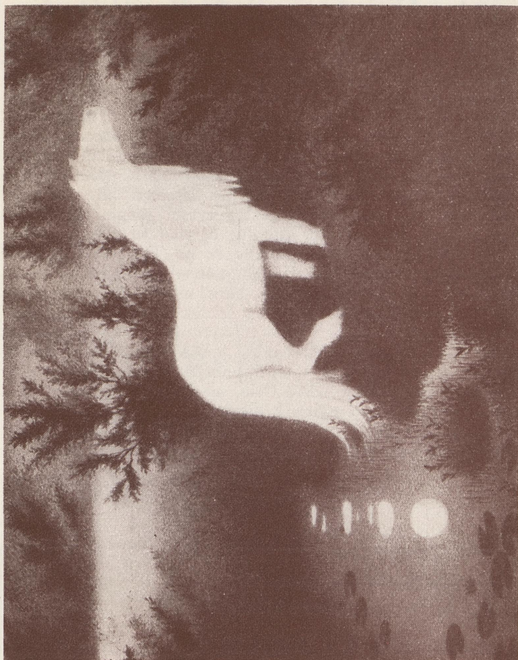
«Nokken». Akvarell av Th. Kittelsen.