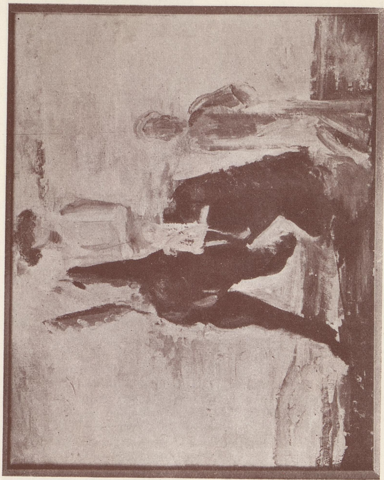
«Rytteren» av Bjarne Ness.