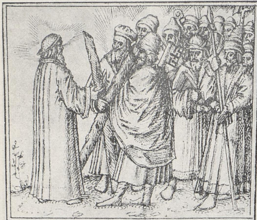
J. Rouff, Weingartenspiel: Gud Fader med apostlane — oppført 1539.