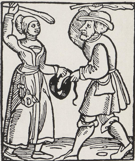
Munnhoggeri mellom mann og kone frå Hans Sachs' fastelavensspel «Der Bös Rauch». Tresnitt frå 1551.

I eit program-forord skreiv Peter Weiss om oppgåva til våre dagars teater: «Alt som skal framstellast på teatret i dag må vera representativt for eit eller anna synspunkt i verda ikring oss. På scenen må noko bli meddelt eller bli kasta nytt lys over; tilskodaren skal oppdage noko og til det