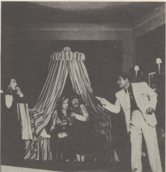
Fra oppførelsen på Carl Johan Teatret i 1936. T. v. Per Aabel — i sengen Wenche Foss og Thorleif Reiss. T. h. Leif Enger.

Uhellsvanger, eggende, sorgløs, erotisk, funksjonell, fantastisk, pompøs, frivol; Art Nouveau var alt dette. Den var et opprør mot mekaniske proporsjoner og symmetri i kunsten; den var et bevisst forsøk på å bringe poesi og liv inn i arkitekturen og i ting som ingen til da hadde tenkt seg å forsøke å gjøre vakre. Den var også en del av en omfattende bevegelse i kamp for frigjøring fra vedtatte normer på sosiale, politiske og personlige områder. Regelmessighet og måtehold i liv og kunst har flere ganger hatt overtaket siden den korte perioden omkring århundreskiftet, da Art Nouveau blomstret, og i lengre tid ble bevegelsen avvist som ubalansert, stygg og unaturlig. Idag ser man igjen anderledes på den.