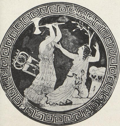
Klytimestra drep Cassandra, vasebilette frå omlag 430 f.Kr.

Atrevs hadde to søner, AGAMEMNON og MENE- LAOS , medan Tyestes' mest kjende son var AI- GISTOS . Atridane var begge vidkjende og mek- tige kongar. Dei voks opp hos kongen av Sparta, Tyndareos, og hans dron- ning Leda. Agamemnon gifta seg med kongedot- tera KLYTAIMESTRA og vart konge i Mykene, som han vann i strid med Ai- gistos. Aigistos hadde til sist lykkast i å drepe Atrevs og såleis hemne brørne sine. Menelaos på si side gifta seg med