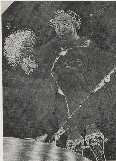
Tragisk skopespelar, frå eit vasebilete (seint i det fjerde hundreåret f.Kr.)

Slik omfatta teatret heile livet for dei gamle hellenane. Men for Aiskylos var nok tragedien hovudsaka, jamvel om «Orestien» endar med ein klår happy end. Det var gjennom «lidings sut» at menneska kunne lære både seg sjølv og gudane sine å kjenne. Dette er også hovudtanken i det andre mest kjende dramaet hans, det om titanen Prometevs, han som stjal elden frå Zevs og gav den til menneska, og til straff vart fengsla til ein bergvegg i Kaukasus i 30 000 år. Her er det den gudommelege menneskeve- nen som må lide for at denne usle skapningen,