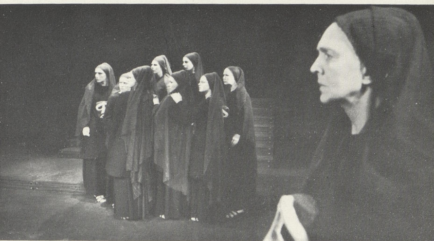
Scene frå «Gravofferet»

Kva har ein over 2000 år gammal tekst å fortelje menneske i dag? Boskapen i gresk tragedie, og spesielt «Orestien» som blir framført for første gong her i landet, er oss tilsynelatande meir uvedkomande enn den var for atenarane år 458 før Kristus. Vår hybris er meir samansett og mindre openberr. Med våre storslåtte oppdagingar og kostbare måneferder fell vi mykje lettare for freistinga til å tru at vi produserer vår eigen kunnskap og berre veit det vi kan prove. Dermed stenger vi oss ute frå rikdomen i alt som er til. Vår blanding av dugleik og einfald, vår blinde tru på statistikk, analyse og grundig planlegging får oss til å gløyme at system kan stryke ut tre fjerdedelar av sanninga.