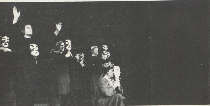
Scene frå «Agamemnon»

Teologisk aspekt: Vi ser byrjinga på den nye «himmelkongen» Zevs' regjeringstid. Dei gamle gudane, Uranos og Kronos, representerer det primitive hemnprinsippet som Zevs via barna sine, Apollon og Atene, utviklar til miskunnsprinsippet. Åskodeleggjort ved hemnåndene sin metamorfose. Aspektet sett i «vitskapeleg» lys: Eit kosmos i stadig utvikling og omskaping, ei kanalisering av krefter til samvirke og harmoni.