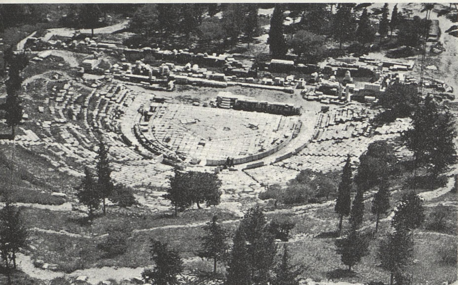
Dionysos-teatret i Aten, slik det er i dag

Det ein veit er at dramaet vart instituert av «tyrannen» Peisistratos i året 534 f.Kr. som ein viktig part av den store Dionysia-festen i slutten av mars månad, — ein vårfest og ein nasjonalfest, dit venene av det attiske statssambandet òg vart innbedne. Vidare at Thespis var den første kjende dramaforfattar-aktøren som tok på seg tilskipinga av den første framsyninga på Dionysos-teatret, som låg i skråninga