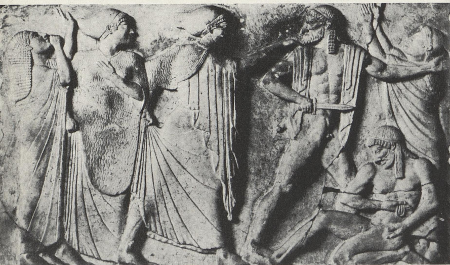
Orestes drep Aigistos, eit romersk relieff i arkaisk stil, eller kan hende kopi av ein arkaisk original

PARIS var son av Priamos, kongen av Troja, og dronninga hans, Hekuba. Da han vart fødd, vart det spådd at han ville bli heimbyens undergang, og prestane såg helst at han vart drepen med det same. I staden sørgde mor hans for at han vart gitt til ein gjetar – som sparte livet hans og oppseda han i fridom på fjellet. Paris voks opp til ein svært vakker og vis mann – så vis at gudane fann han best skikka av alle til å avgjere striden mellom dei tre gudinnene Hera, Atene og Afrodite om kven av dei som var den vakraste. Paris valde Afrodite, avdi ho lova han den vakraste kvinna i verda – Helena – til kone.