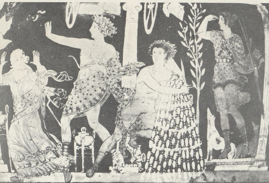
Apollon vernar Orestes frå hemnåndene, vasebilete frå omlag 370 f.Kr.

Da Menelaos kom heim og fekk vite om rovet, kalla han saman alle dei mektigaste menn i Hellas til eit hærtog mot Troja — blant dei Agamemnon og Odyssevs, Akilles, Nestor og Ajax.